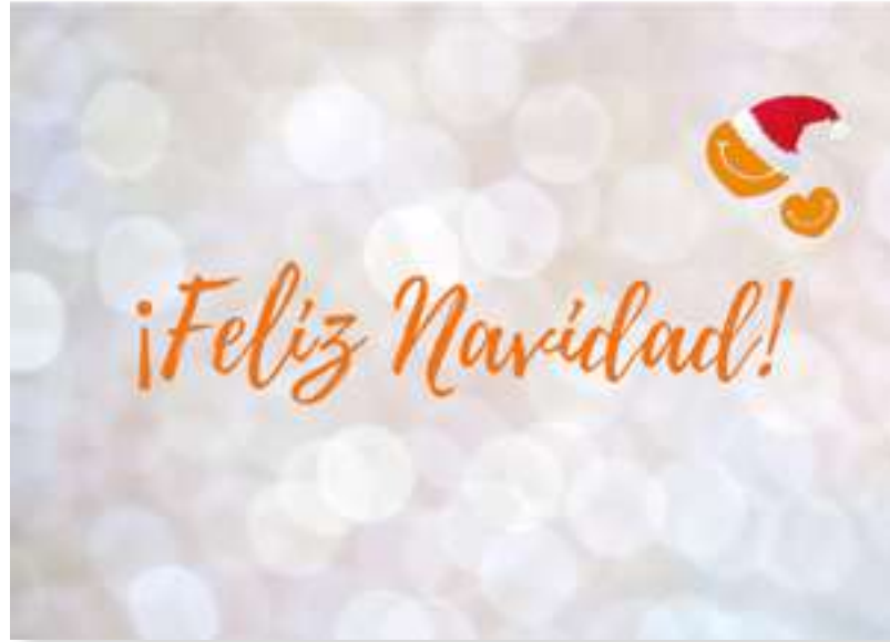
FT21-03 Autor: Fundación Theodora 21x15 cm 1,3€ unidad (sobre incluido)