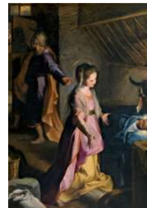
FT21-02 La Natividad Autor: Corrado Barocci Museo del Prado, Madrid 13x21 cm 1,3€ unidad (sobre incluido)