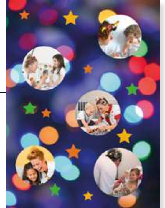
FT21-05 Autor: Fundación Theodora 15x21 cm 1,3€ unidad (sobre incluido)

I.V.A incluido. Gastos de envío no incluidos Imágenes disponibles en formato digital - Consultar costes de personalización