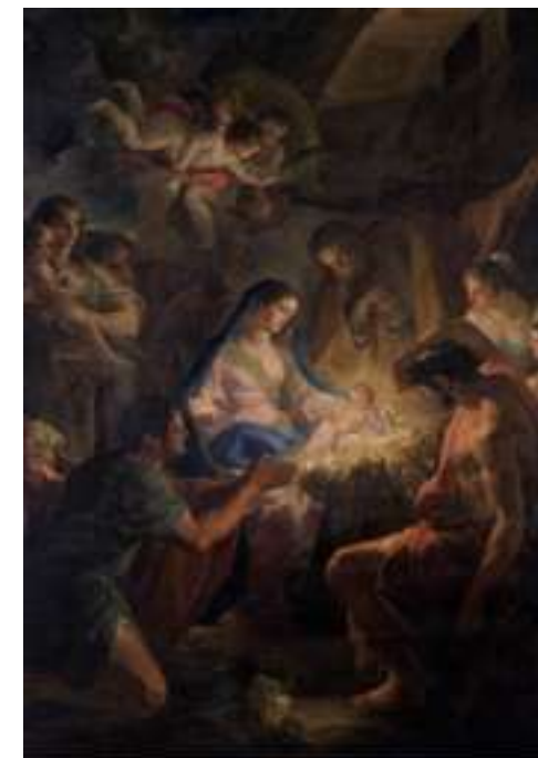
FT21-01 Adoración de los Pastores Autor: Corrado Giaquinto Museo del Prado, Madrid 13x21 cm 1,3€ unidad (sobre incluido)