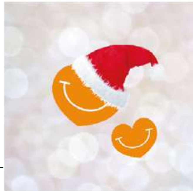
FT21-04 Autor: Fundación Theodora 15x15 cm 1,3€ unidad (sobre incluido)

I.V.A incluido. Gastos de envío no incluidos Imágenes disponibles en formato digital - Consultar costes de personalización