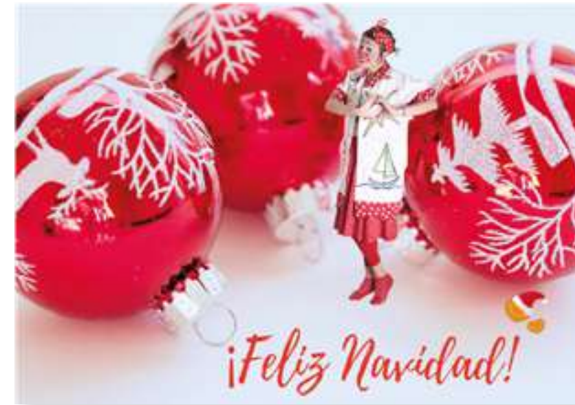
FT21-06 Autor: Fundación Theodora 21x15 cm 1,3€ unidad (sobre incluido)

I.V.A incluido. Gastos de envío no incluidos Imágenes disponibles en formato digital - Consultar costes de personalización