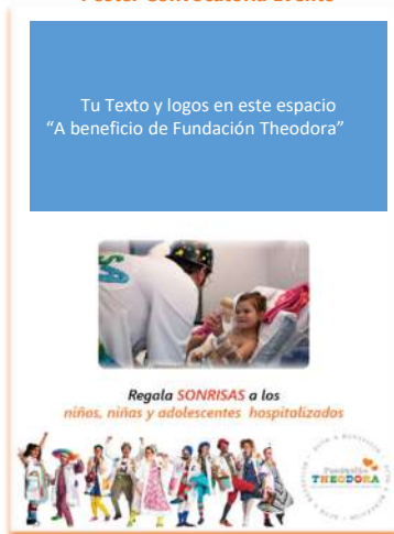
Poster Convocatoria Evento